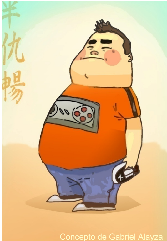
Concepto de Gabriel Alayza