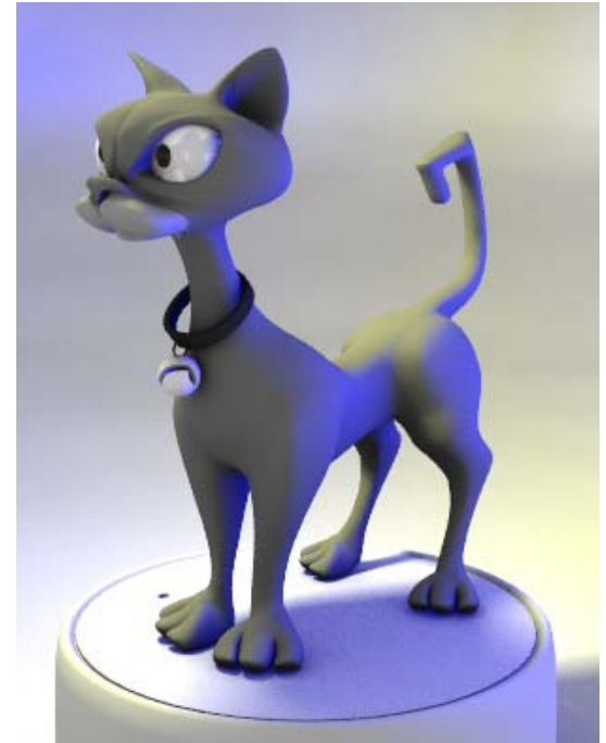
“Renato, el Gato”

Episodio 6. Nuestros héroes han llegado a Moscú, a la base espacial rusa. Triste noticia, Laika fué lanzada al espacio y vive en una estación orbital. Tras la decepción inicial, Pogo decide continuar su búsqueda al recordar las sabias palabras de su abuelo: “Lucha siempre por tus sueños”.