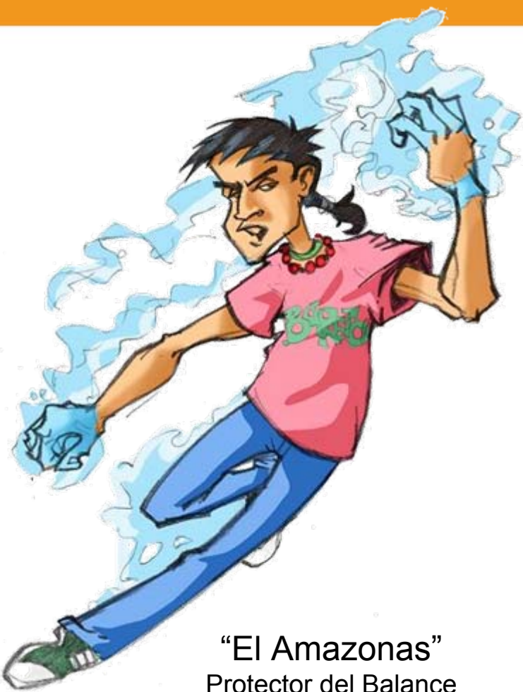
“El Amazonas” Protector del Balance

“Un grupo de jóvenes peruanos, con sorprendentes poderes sobrenaturales, tendrán que descubrir y combatir a las fuerzas oscuras que gobiernan al mundo, si quieren evitar el terrible futuro que estas planean para la raza humana”.